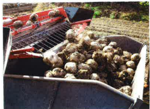
拾い上げたコンニャクをバケットへ収納