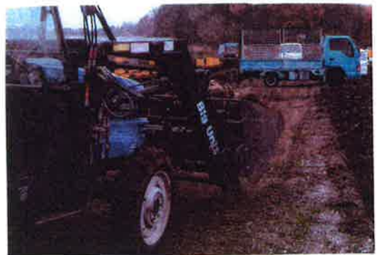
収納したコンニャクを金網コンテナへ