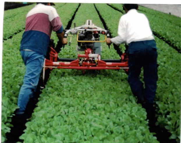
より効率的な二人作業