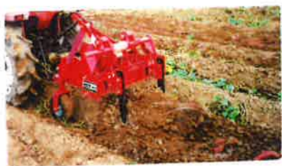
UPN-503N実演風景 プロペラシャフト付