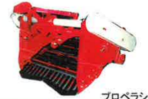
プロペラシャフト付

トラクタ用自動掘取機 (馬鈴薯・こんにゃく・里いも他) ※標準オートヒッチ対応型もあります