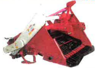
UTD-1055RD プロペラシャフト付