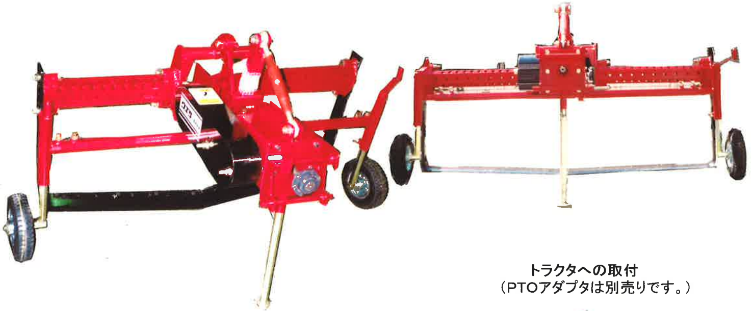
トラクタへの取付 (PTOアダプタは別売りです。)