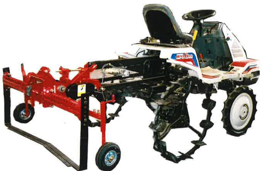
根切機を装着した状態