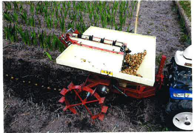
USA-1G (鎮圧ローラ、ディスクなし)