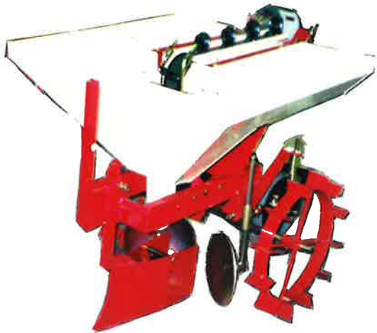
USA-1LG (鎮圧ローラ、ディスク付)